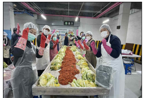
< 2024년 사랑나눔 김장축제 >