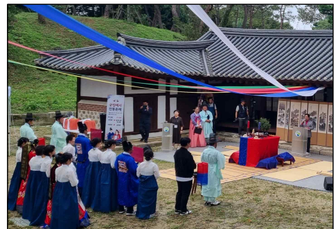
< 2024년 궁집에서 전통혼례 >