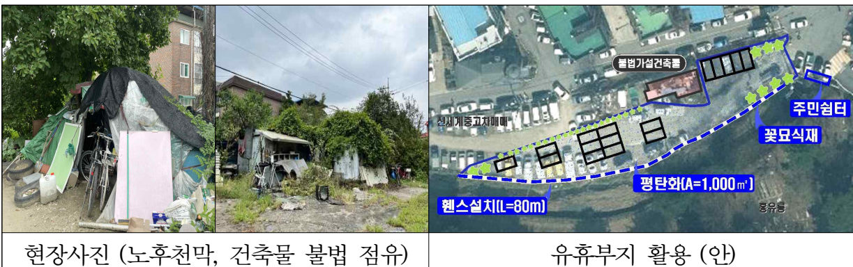
현장사진 (노후천막, 건축물 불법 점유)