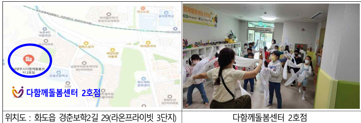
위치도 : 화도읍 경춘보학2길 29(라온프라이빗 3단지)